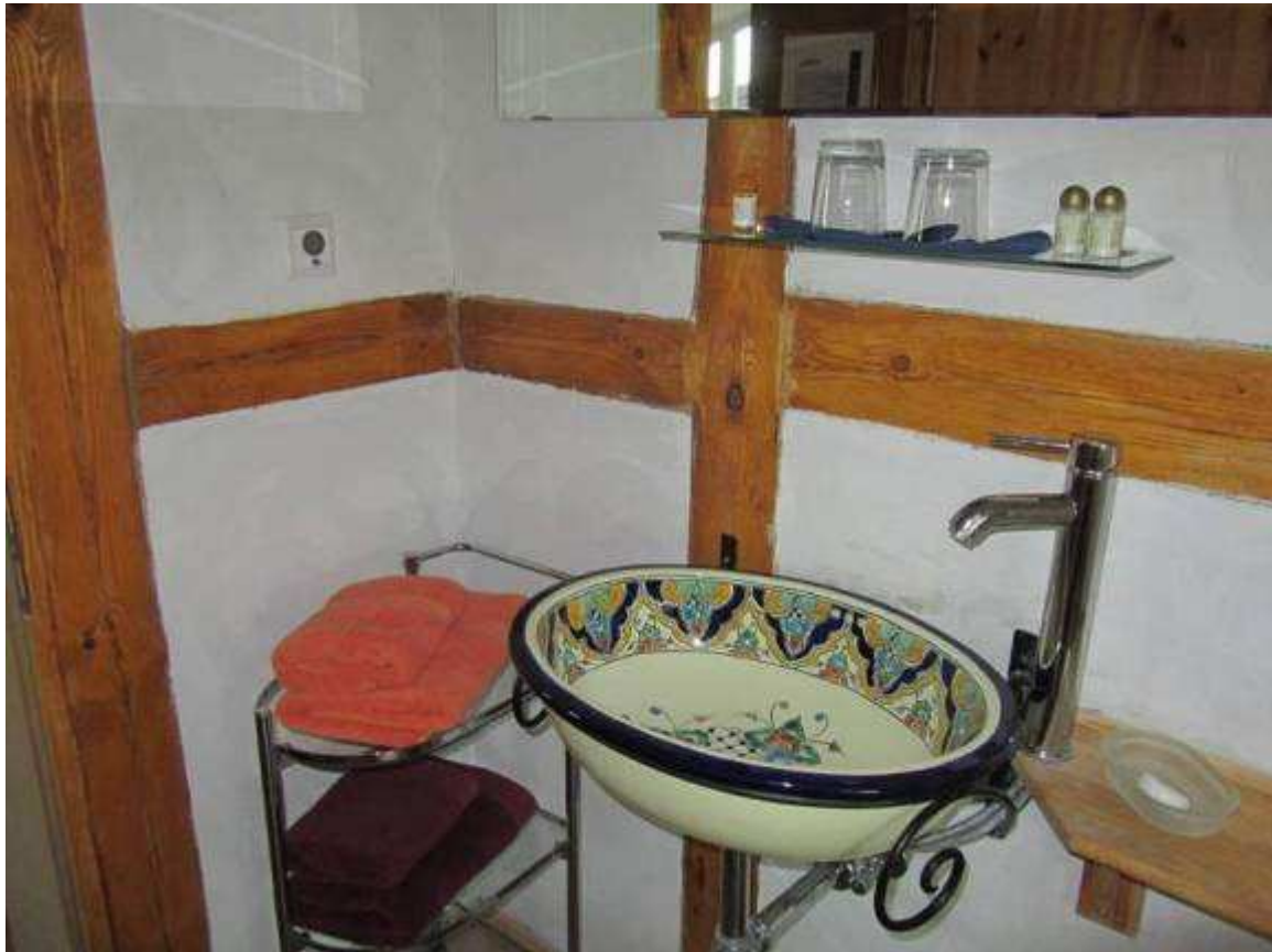
Moderne Duschen komplettieren die behutsame Modernisierung.