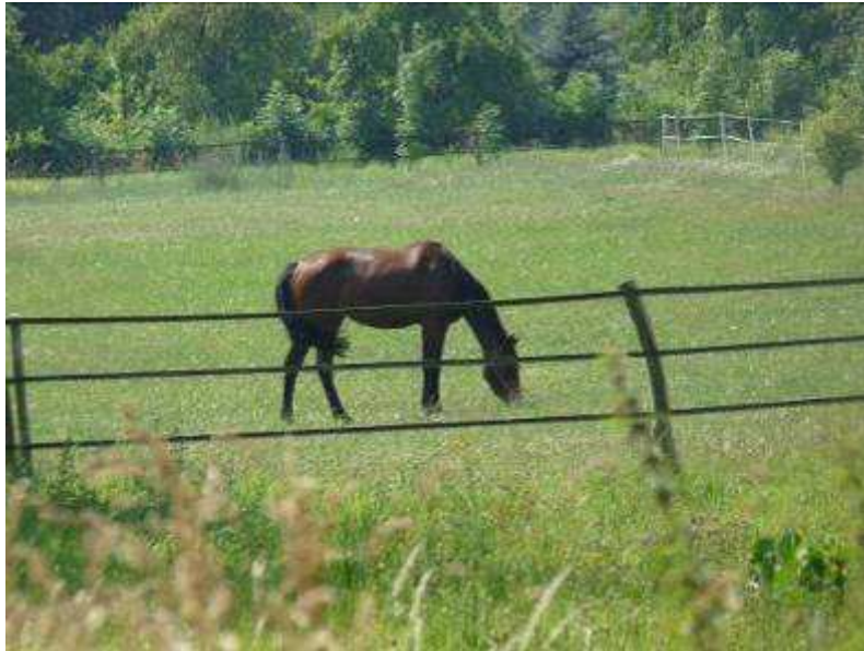
Pferde im Dorf

Refugium Uckermark Dorfstr. 26, 17326 Brüssow/ OT Trampe willkommen@refugiumuckermark.de www.refugiumuckermark.de Tel. 039742 80419 Ums.St.Nr. 13/375/60364