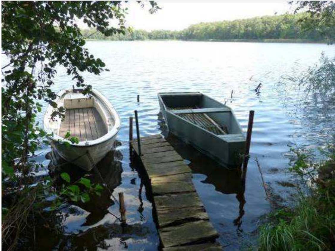
Der Krebssee, ein weiterer See bei Trampe, einer von sechs Seen in der näheren Umgebung !!!!

Refugium Uckermark - genussvoll wohnen, Seminare intensiv erleben