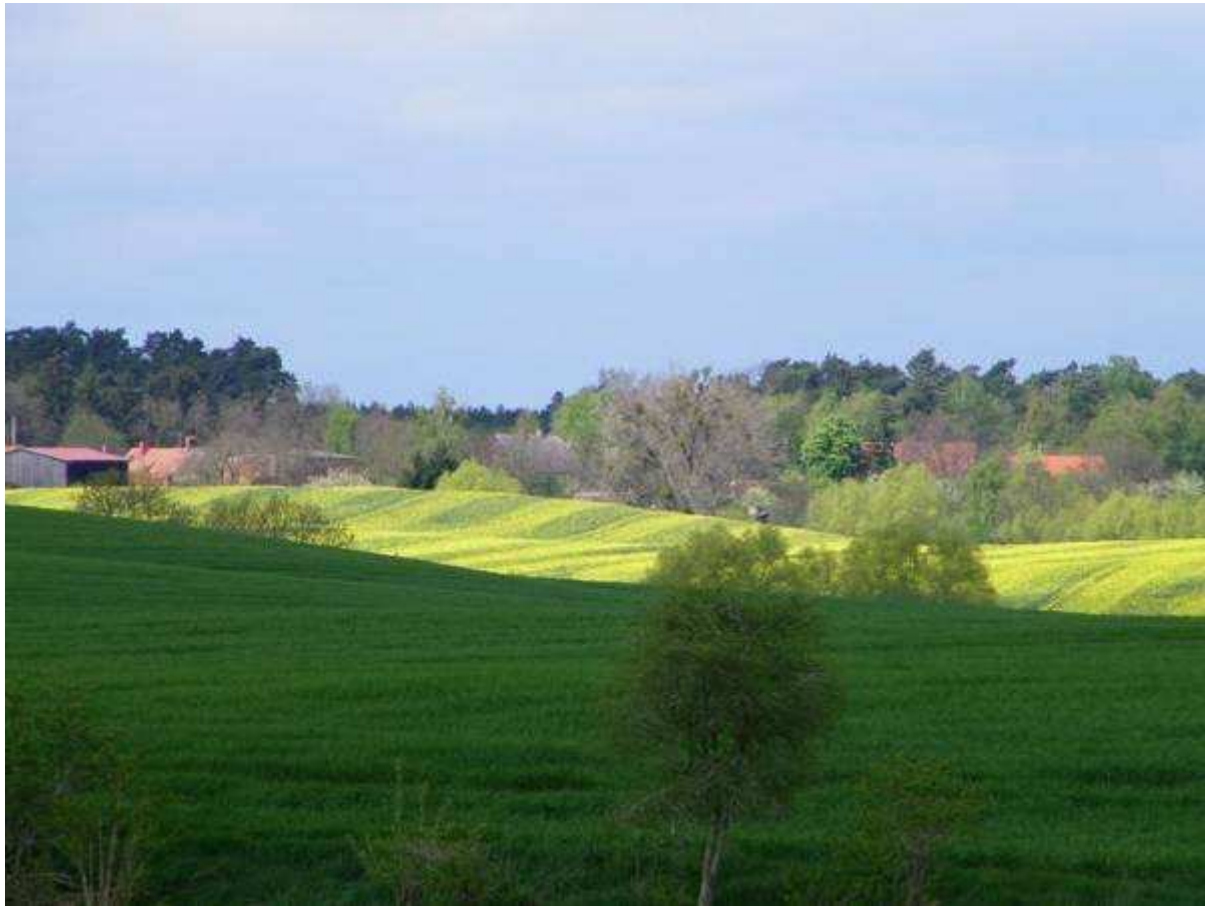
Der Blick von Ihrer Terrasse ....