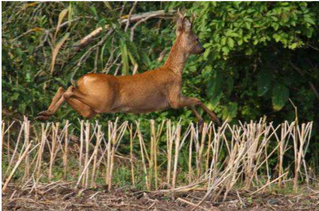
... und Dammwild immer wieder ...