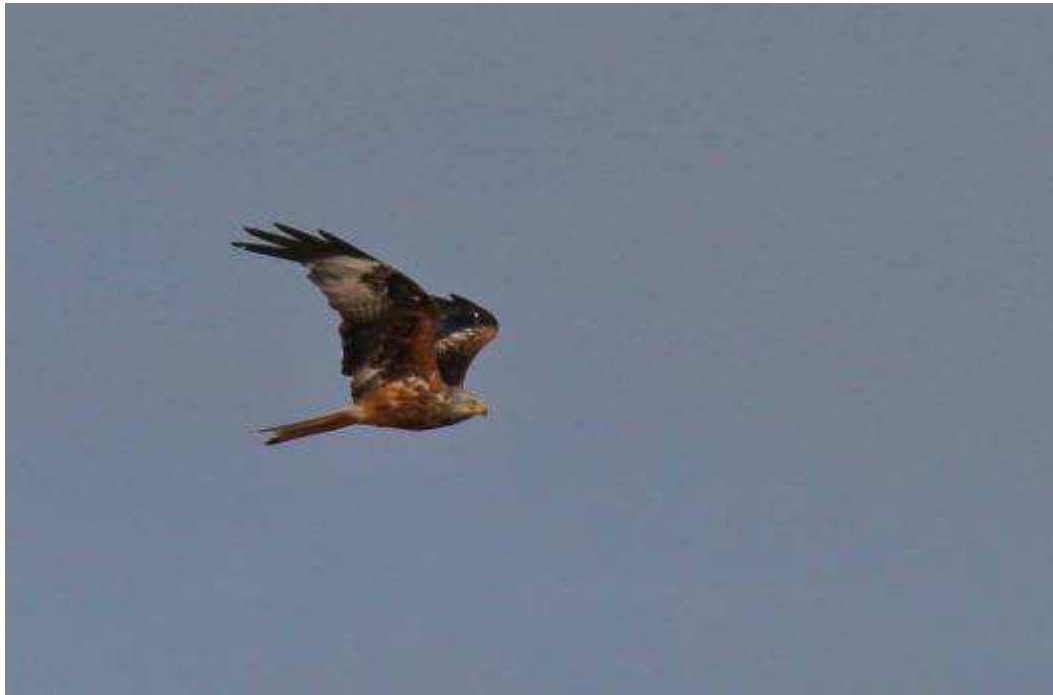
Die Tierwelt um Trampe

Refugium Uckermark Dorfstr. 26, 17326 Brüssow/ OT Trampe willkommen@refugiumuckermark.de www.refugiumuckermark.de Tel. 039742 80419 Ums.St.Nr. 13/375/60364