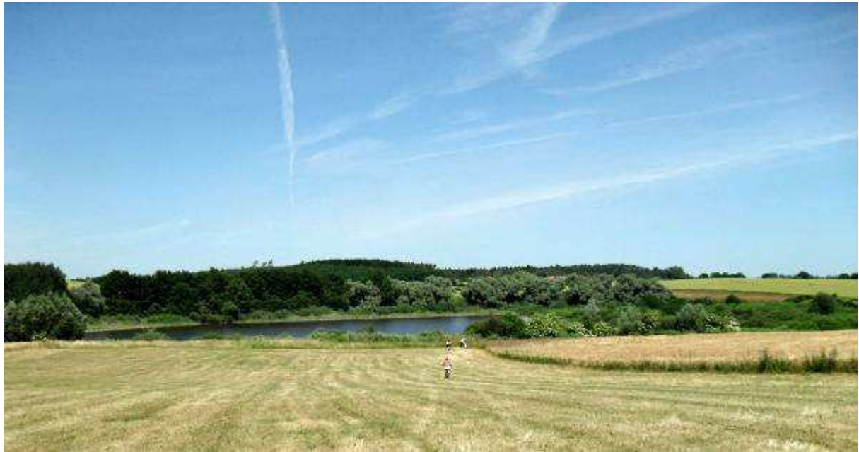
Der Weg zum Trampe See, 10 Minuten zu Fuß

Refugium Uckermark Dorfstr. 26, 17326 Brüssow/ OT Trampe willkommen@refugiumuckermark.de www.refugiumuckermark.de Tel. 039742 80419 Ums.St.Nr. 13/375/60364