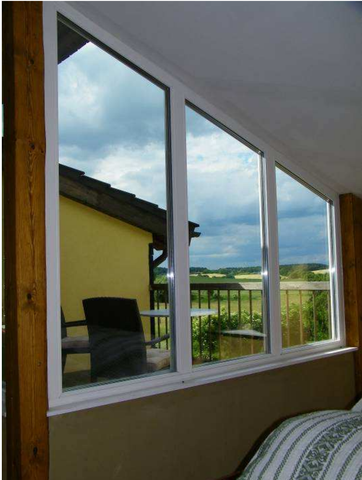
Der Blick vom Bett aus ...

Refugium Uckermark - genussvoll wohnen, Seminare intensiv erleben