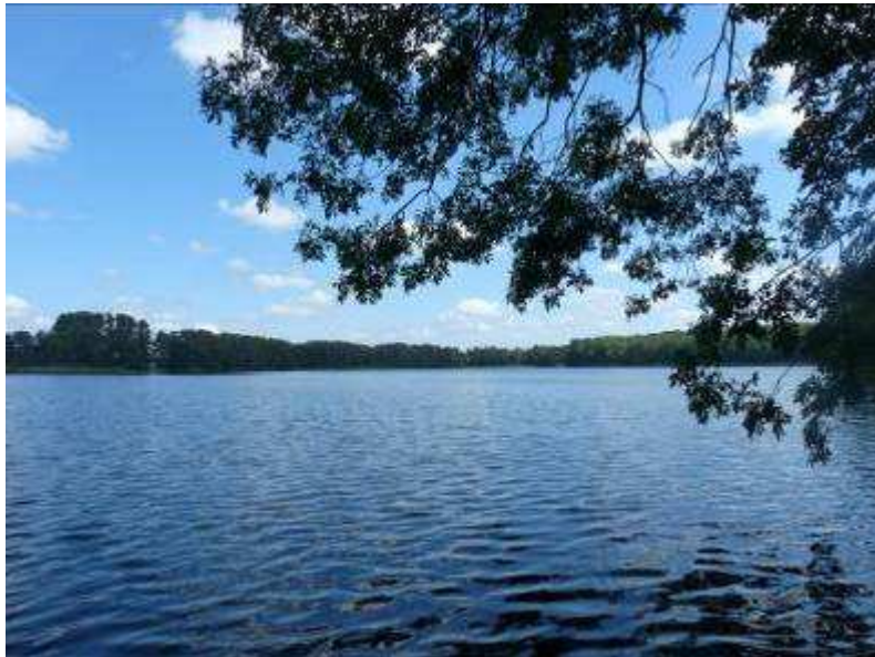
Der Brüssower See

Refugium Uckermark Dorfstr. 26, 17326 Brüssow/ OT Trampe willkommen@refugiumuckermark.de www.refugiumuckermark.de Tel. 039742 80419 Ums.St.Nr. 13/375/60364